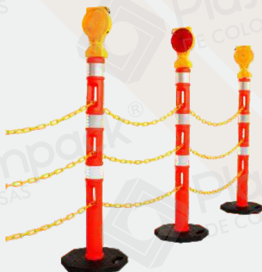
✓ Poste Delineador Tubular con cadenas y flashers de advertencia.