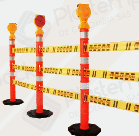
✓ Poste Delineador Tubular con cinta plástica de demarcación y flashers de advertencia.